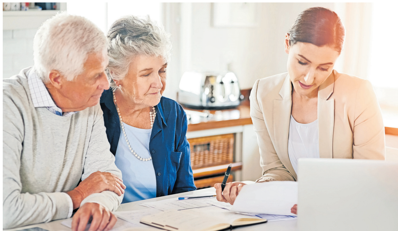
Informations- und Beratungsstelle Alter (IBA) bietet Informationen zu vielfältigen Bereichen.

Derzeit liegen die Erwerbsgrenzen bei einer alleinstehenden Person bei 65 000 Franken und bei Ehepaaren bei 77 000 Franken (massgebender Erwerb, Steuerklärung 2022). Der Antrag ist online jeweils bis Ende Oktober beim Amt für Soziale Dienste einzureichen. Wird die Prämienverbilligung verfügt, so wird diese neu direkt in der monatlichen Prämienrechnung vergütet. Wer Hilfe beim Antrag braucht oder weitere Auskünfte benötigt, kann sich an das